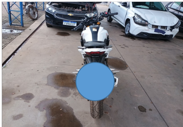
TRASEIRA DA MOTO