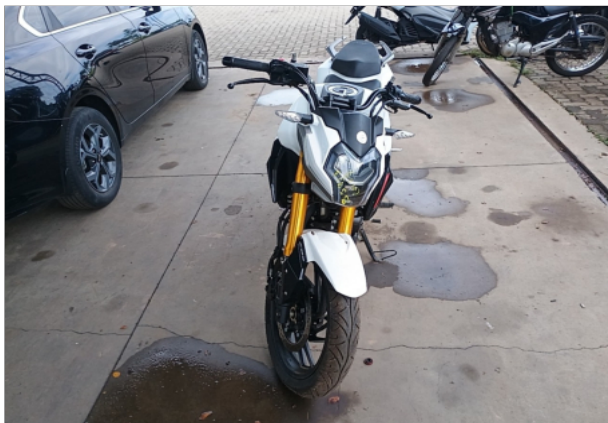
FRENTE DA MOTO