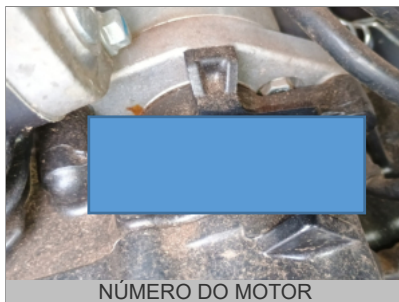
NÚMERO DO MOTOR