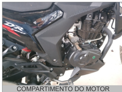
COMPARTIMENTO DO MOTOR