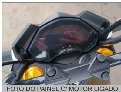
FOTO DO PAINEL C/ MOTOR LIGADO