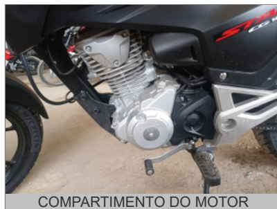
COMPARTIMENTO DO MOTOR