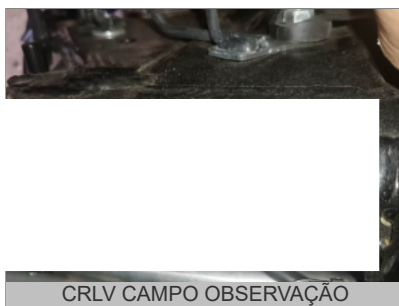
CRLV CAMPO OBSERVAÇÃO