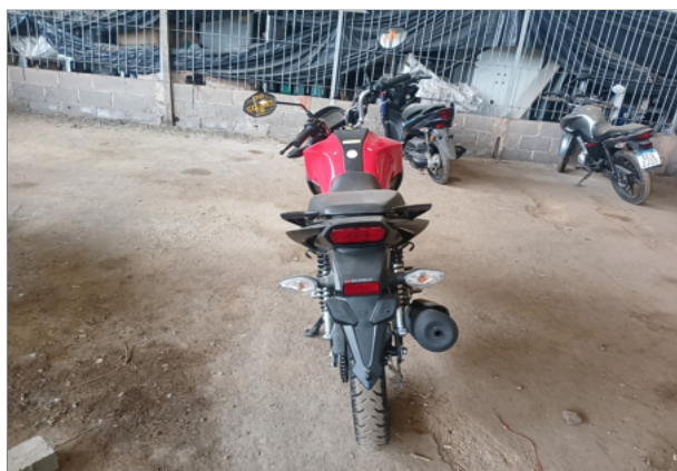
TRASEIRA DA MOTO