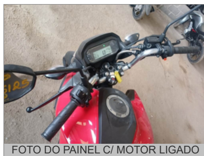
FOTO DO PAINEL C/ MOTOR LIGADO