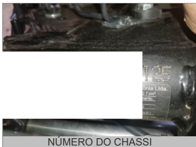
NÚMERO DO CHASSI