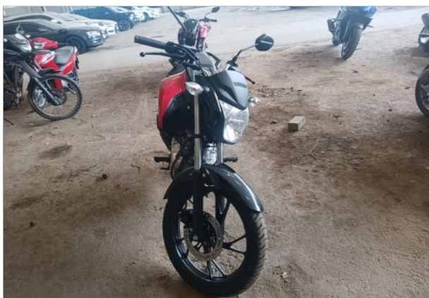
FRENTE DA MOTO