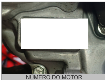
NÚMERO DO MOTOR